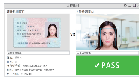
人脸识别 / 人证比对