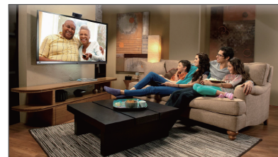
家庭客厅 大屏互动, 远程陪伴