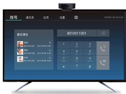
TVX-PHONE 电视电话通讯软件