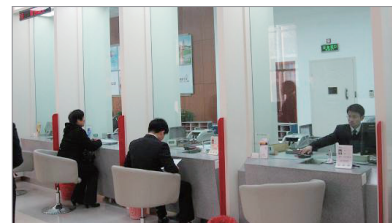
商务窗口 人脸采集, 业务监控