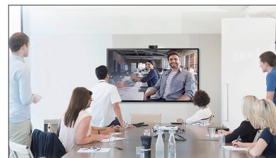
公司会议室 视频会议、远程高清